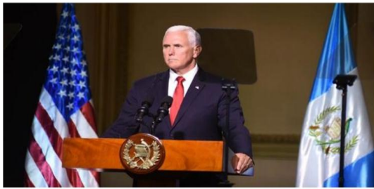
El vicepresidente Mike Pence interviene durante la conferencia conjunta con los mandatarios del Triángulo Norte.