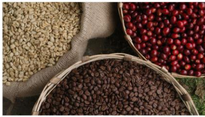
TLC fortaleció a la industria agropecuaria

En las últimas dos semanas el precio del crudo registró un comportamiento anormal en su cotización, incrementándose de US$65 a US$75 por barril WTI. Según expertos el alza se debe a la creciente demanda energética, a la reducción de los inventarios de petróleo en los EE. UU., reducción de producción decretada por la OPEP y a la crisis en el Medio Oriente. Este incremento provocará a su vez el movimiento de precios de los derivados del petróleo.